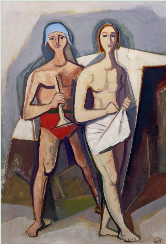
Karl Hofer, Paar, 1951, Öl auf Leinwand

Die Ausstellung zeigt über 60 Gemälde, die die wichtigsten Themen, die ästhetische Kraft und das ihr zugrunde liegende Menschenbild in Hofers Malerei anhand von Beispielen aus allen Schaffensphasen präsentieren.