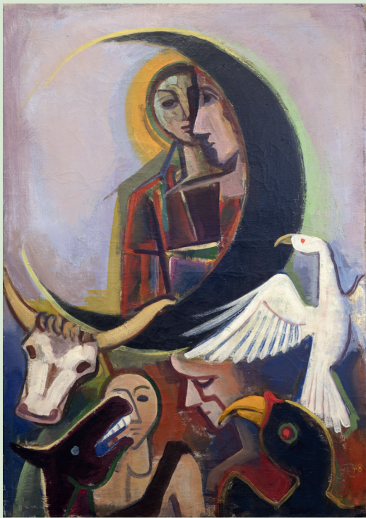
Karl Hofer, Schwarzmond, 1948, Öl auf Leinwand

Ergänzt wird die Ausstellung im 3. Stock von Schloss Achberg um Gemälde von Künstlern der Halleschen Schule, die Anklänge an Hofers Malerei aufweisen, sowie Gemälde von Willi Baumeister (1889–1955). Sie werfen ein Schlaglicht auf die Rezeption Hofers zwischen 1945 und 1955 in Ost und West.