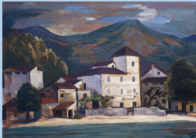
Karl Hofer, Tessiner Landschaft (Caslano), 1932, Öl auf Leinwand